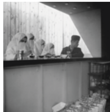
Foire d'Alger, avril 1959, O 53/222. Dans : Pierre Bourdieu : Images d'Algérie. Une affinité élective