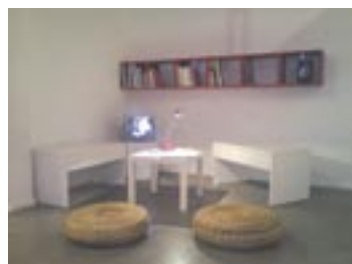
Images d'Algérie de Pierre Bourdieu, novembre 2011.