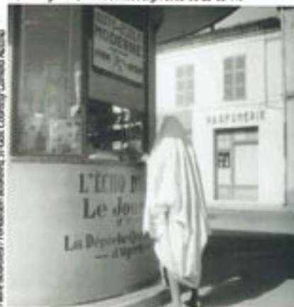
Pierre Bourdieu / Fondation Bourdieu, St Gall. Courtesy Camera Austria

Images d'Algérie. Du 26 novembre au 12 février. Galerie Stimultania, 33, rue Kogernck, 67000 Strasbourg. Tél. 03-88-23-63-11.