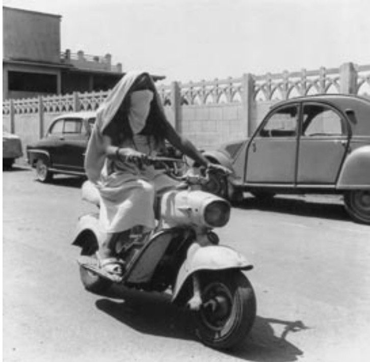
Sans titre, R 1. Dans : Pierre Bourdieu : Images d'Algérie. Une affinité élective.