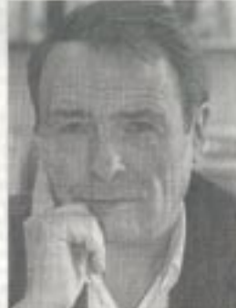
Pierre Bourdieu.

3 Jusqu'au 12 février, chez Stimultania, 33 rue Kogmeck, Du mercredi au dimanche, de 14h à 18h30. www.stimultania.org