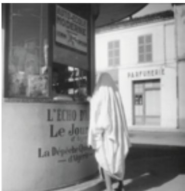
Sans titre, O 50/251. Dans : Pierre Bourdieu : Images d'Algérie. Une affinité élective