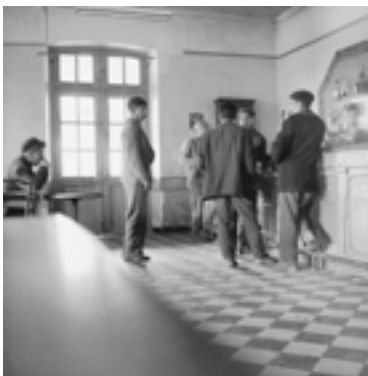
Cheraïa. Centre de regroupement en construction, N 85/766. (Couverture du livre : Le Déracinement. La crise de l'agriculture traditionnelle en Algérie, Paris 1964). Dans : Pierre Bourdieu : Images d'Algérie. Une affinité élective