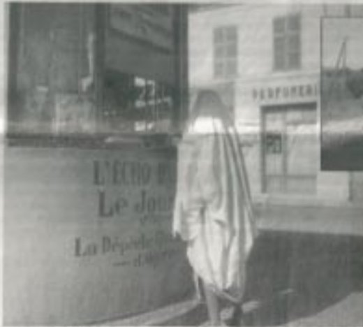
Dans les rues d'Algiers.