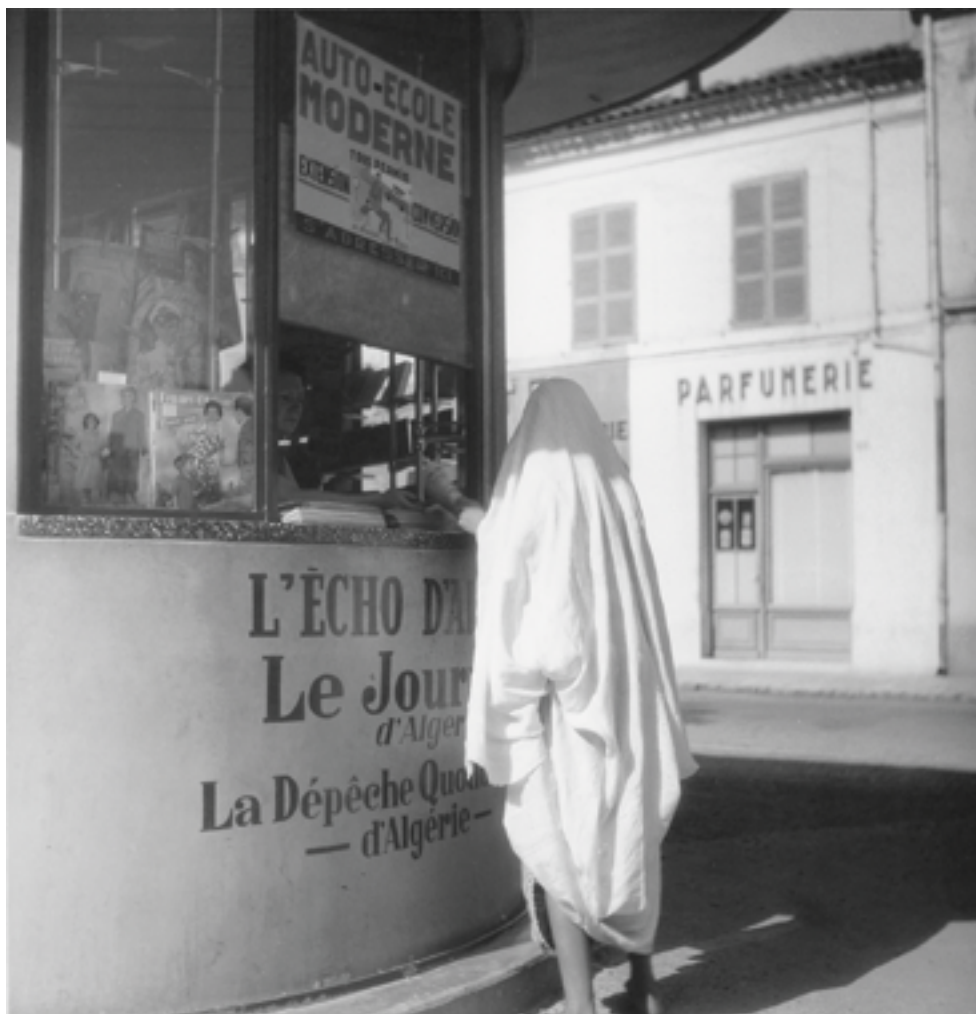
Sans titre, O 50/251. Dans : Pierre Bourdieu : Images d'Algérie. Une affinité élective.

* une exposition proposée par Strasbourg-Méditerranée, l'Université de Strasbourg et Stimultania