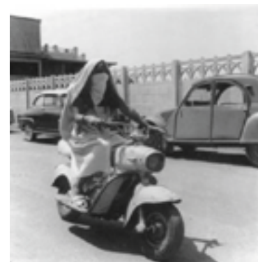
Blida, N 24/465. (Couverture du livre : Algérie 60, Paris 1977). Dans : Pierre Bourdieu : Images d'Algérie. Une affinité élective