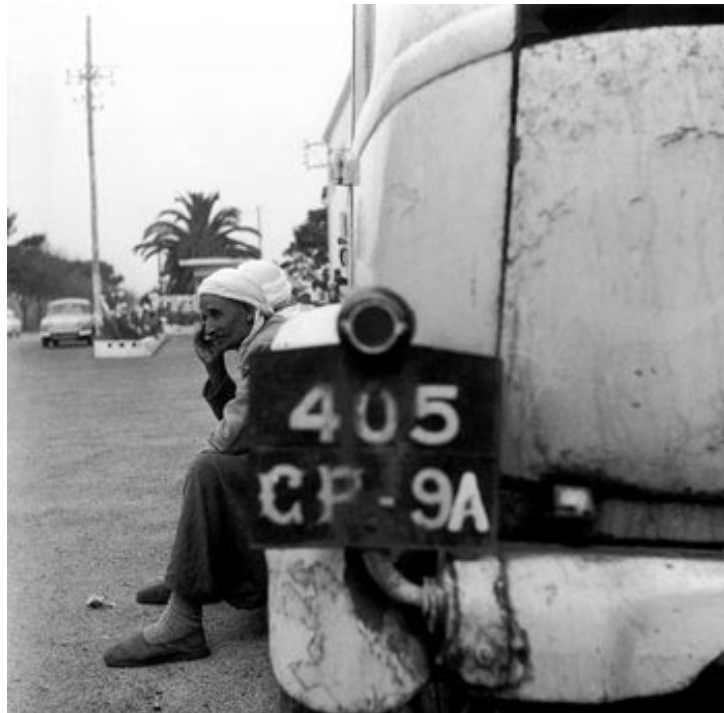
Blida, N 24/465. (Couverture du livre : Algérie 60, Paris 1977). Dans : Pierre Bourdieu : Images d'Algérie. Une affinité élective.