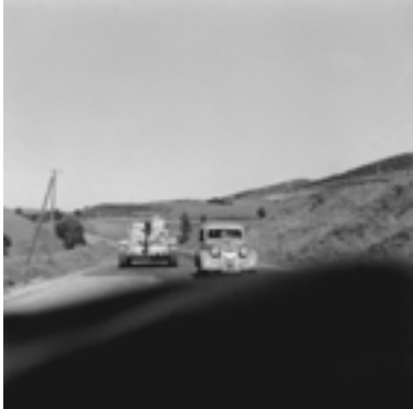
Sans titre, N 17/464. Dans : Pierre Bourdieu : Images d'Algérie. Une affinité élective © Pierre Bourdieu / Fondation Bourdieu, Saint-Gall, Suisse. Courtesy : Camera Austria, Graz, Autriche.

Florie Brunet 03 88 23 63 11 florie.brunet@stimultania.org