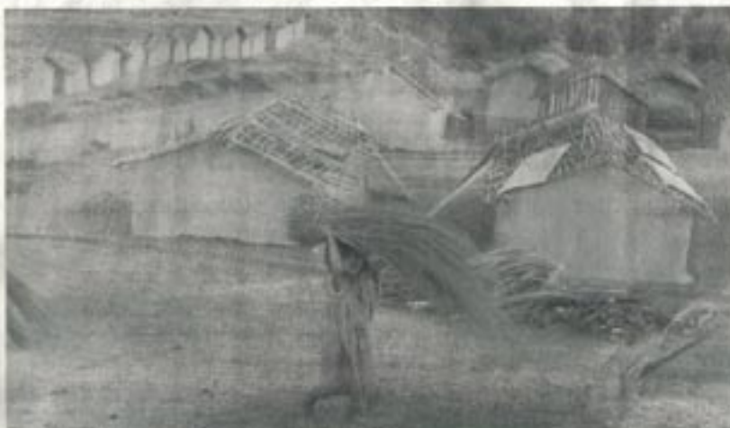
Dans un camp de regroupement mis en place par l'armée française.