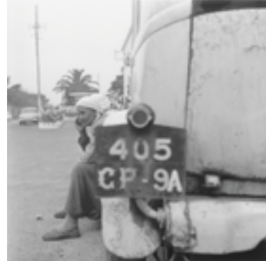
Bilda, N 24/465. Dans : Pierre Bourdieu : Images d'Algérie. Une affinité élective