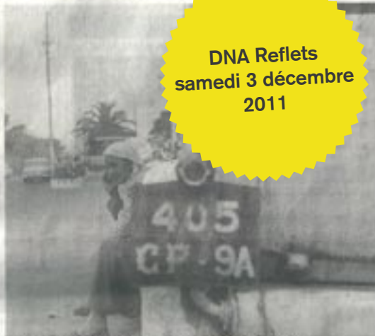
Une pratique photographique située souvent dans «l'instant volé».